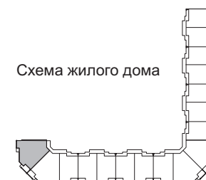
Схема жилого дома

ОДО "Вигеврострой": г.Минск, ул.Богдановича, д.122, комн. 4 тел. (017) 266-22-85, 266-22-87