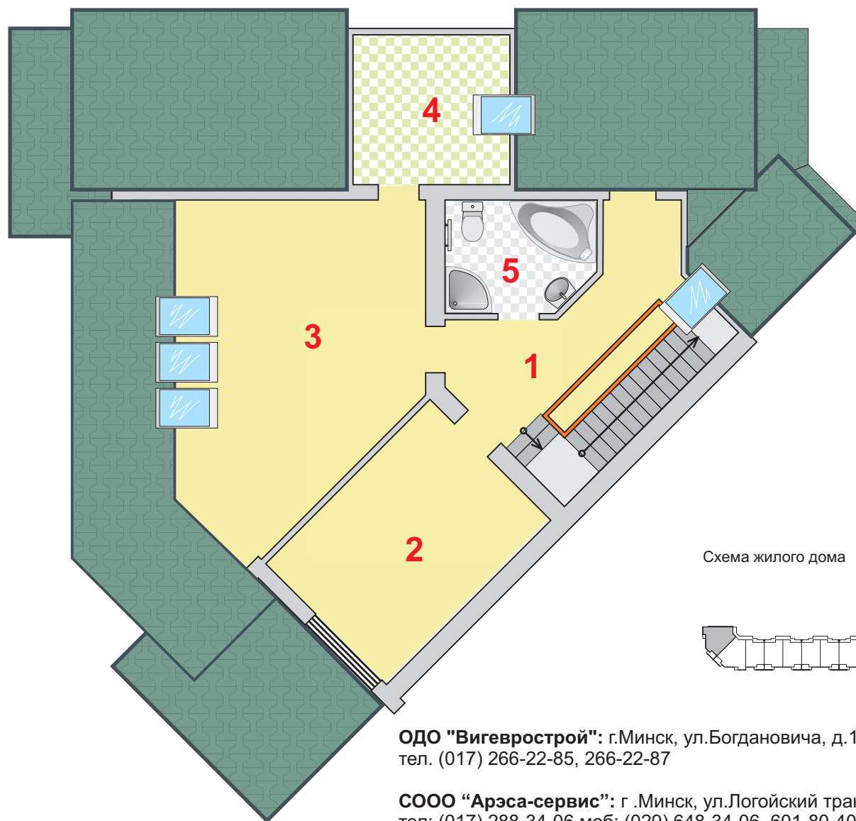
Схема жилого дома

ОДО "Вигеврострой": г.Минск, ул.Богдановича, д.122, комн. 4 тел. (017) 266-22-85, 266-22-87